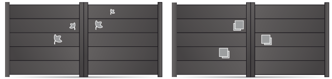
207.147 Petite feuille d'érable PS 207.148 Grande feuille d'érable PS