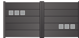
207.141 Carré 70 x 70mm 207.153 Carré 120 x 120mm 207.140 Carré 180 x 180mm