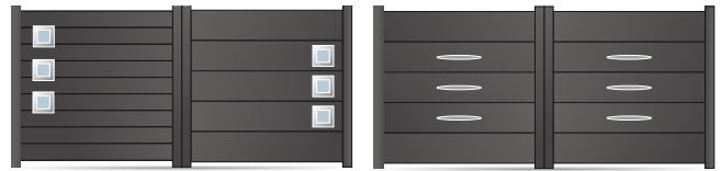
207.154 Hublot verre dépoli