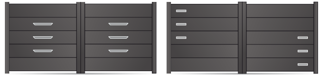
207.145 Trapèze 430 x 40mm